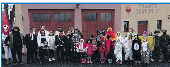
V Chodské Lhotě.