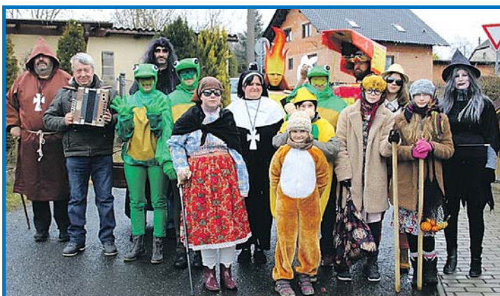
V Nové Vsi.