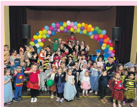
Také děti z Kouta a okolí báječně zatančily a zasoutěžily na maškarním plese. E. Šimová