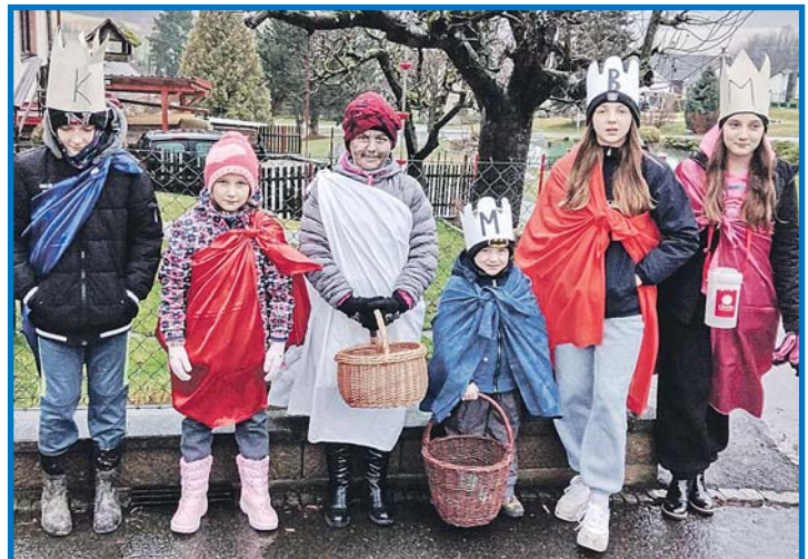
Hned 4. ledna uspořádali v Loučimi Tříkrálovou sbírku a v deštivém počasí sešlo se dětí jen šest, takže tak tak mohly obejít obec na dvě party. Přesto se podařilo vybrat celkem 5 365,- Kč. O 125 korun více pak vybrali Tři králové ve stejně početném Libkově. Z. Huspek