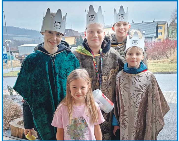
V Koutě na Šumavě se konala Tříkrálová sbírka pod záštitou České katolické charity 5. až 9. ledna. Ke koledování se připojila také obec Spáňov a obec Oprechtice. V Koutě na Šumavě se vybralo 64 696 korun. Děkujeme! Obec Kout na Šumavě