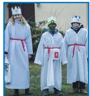
Také v Nové Vsi (zleva) a v Kolovci proběhla každoroční Tříkrálová sbírka. (šk, pd)