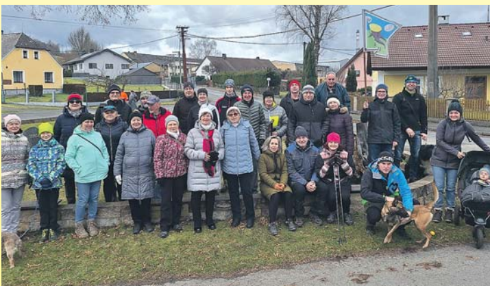
Start Novoročního pochodu Brnířov – Štefle. V cíli se sešlo 33 lidí a 3 psi. Více str. 2